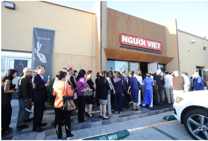
Khán giả xếp hàng từ lúc 5 giờ chiều nhưng nhiều người vẫn phải ra về vì không còn chỗ.