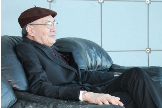
Nhạc sĩ Vũ Thành An