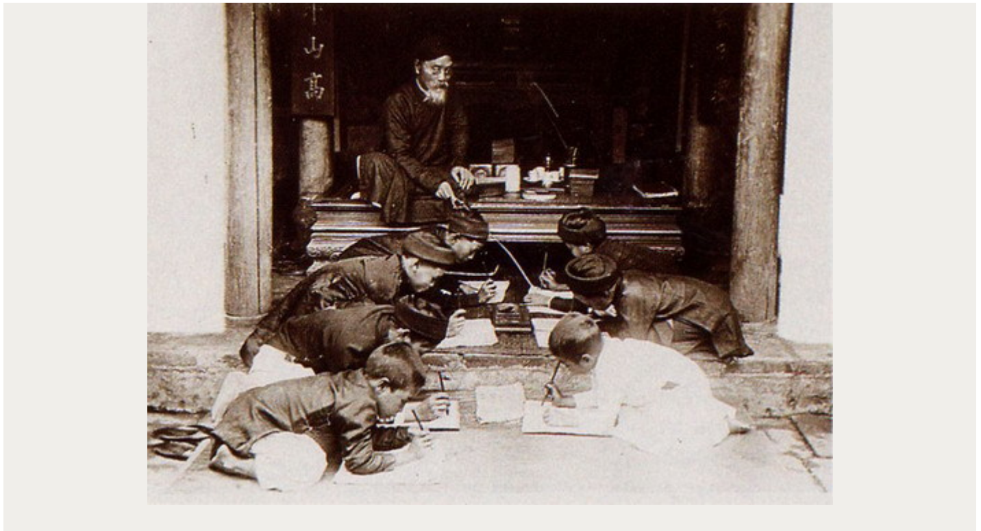
Hình ảnh người thầy giáo và lớp học ngày xưa.

Bẵng đi bao nhiêu năm, một ngày kia khi ông trưởng thành, tìm về quê hương, gặp lại thầy giáo cũ mới ngậm ngùi nhận ra mái tóc thầy đã bạc trắng. Vị nhạc sĩ xúc động tâm sự: "Ngày tôi học với thầy, tôi chỉ cao đến ngang vai thầy nhưng trong lần gặp gỡ ấy, đứng so với tôi thầy chỉ cao ngang vai tôi".