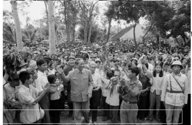
Đẩy mạnh mức bán lẻ kiếm, cường lực đội LÊ THƯỢNG CƠ VÀ KHÁNH THÀNH CỘT CỜ TỔ QUỐC Ở HUYỆN ĐÀO CỎ TỈNH