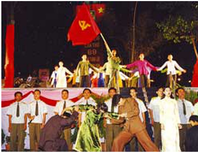
Hoạt cảnh kỷ niệm Ngày thành lập Đảng 3-2 trên đường Phạm Ngọc Thạch.

Nếu nhạc sĩ Văn Cao bắt đầu với những giai điệu trầm hùng, đầy nhiệt huyết của bài Quốc ca thì nhạc sĩ Đỗ Minh cũng ghi danh muôn thuở với tác phẩm "Chào mừng Đảng Lao động Việt Nam", sau được đổi tên là "Chào mừng Đảng Cộng sản Việt Nam" và từ lâu đã trở thành bài ca chính thức của Đảng ta.