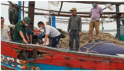
Ứng cứu kịp thời tàu cá có 5 ngư dân gặp nạn trên biển