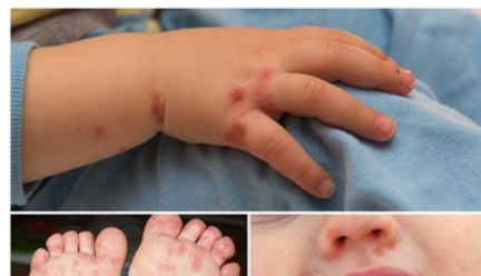
Cứu sống bé gái mắc tay chân miệng nguy kịch