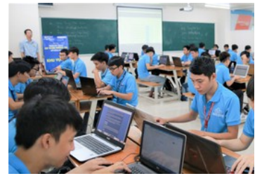
Phát triển nguồn nhân lực trí tuệ nhân tạo - Bài 2: Sức ép từ các đoàn