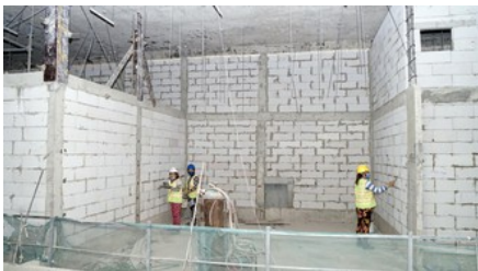
Khó khăn phát triển vật liệu không nung