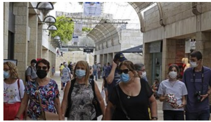
Israel giảm quy mô phòng chống dịch Covid-19