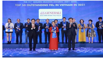
Generali Việt Nam khẳng định vị thế dẫn đầu thị trường về bảo hiểm liên kết đơn vị