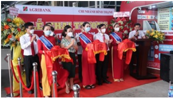
Agribank Chi nhánh Bình Thạnh khai trương AutoBank CDM tại Bệnh viện thành phố Thủ Đức