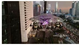
Ăn tối ở nhà hàng treo lơ lửng trên không