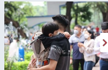
Những giọt nước mắt bé mầm non trong ngày đầu trở lại trường