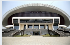
Nhà thi đấu Bắc Giang sẵn sàng tổ chức môn cầu lông tại SEA Games 31