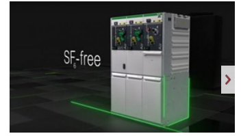
Eenedis và Sschneider Electric hợp tác phát triển giải pháp sáng tạo cho trạm biến áp thế hệ mới