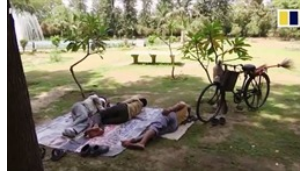
Người Ấn Độ chạt vật vì mùa nóng đến sớm bất thường