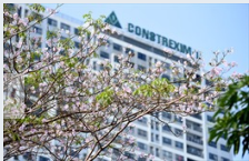
Phong linh hồng nở hoa rực rỡ giữa phố phường Thủ đô