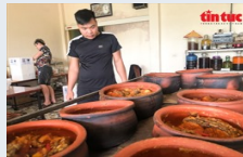
Về Nhân Hậu mục sở thị cả kho làng Vũ Đại